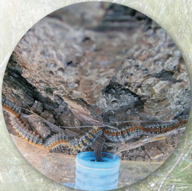
Chenilles dans l'éco-piège