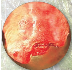
Langue de chien nécrosée